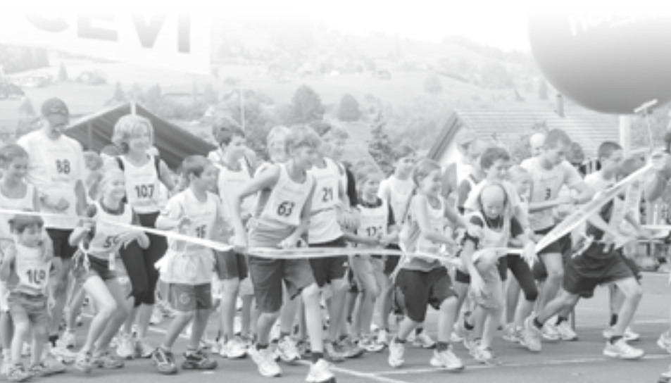
«Horyzon gibt den Start für die gutgelaunten Läuferinnen und Läufer am 2h-Lauf in Grabs frei»

23 JAHRE, LEITER DER CEVI JUNGSCHAR OFTRINGEN THEOLOGISTUDENT AN DER STH BASEL.